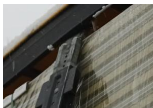
1.2.att. Neatbilstošs statnis