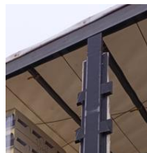
1.3.att. Atbilstošs statnis